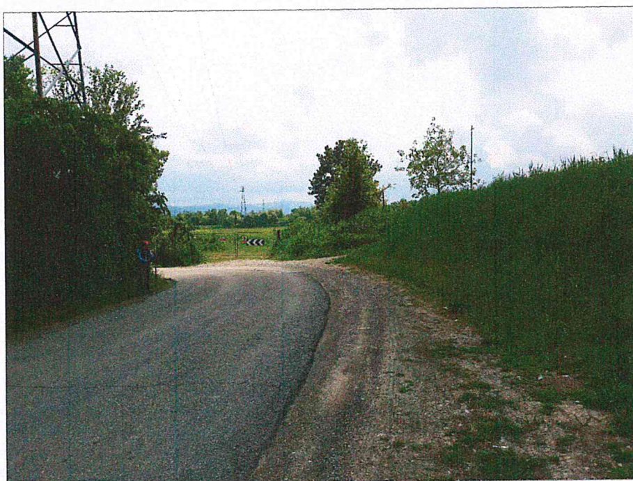
Foto n°3 Particolare dell'argine posto in prossimità del traliccio.